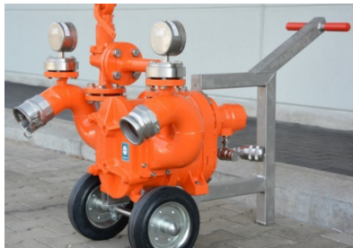
手推车式 - 液压马达驱动