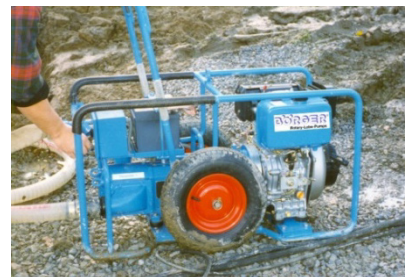
便携式 - 崎岖的场地