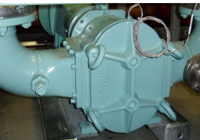
安装在溢油回收船上