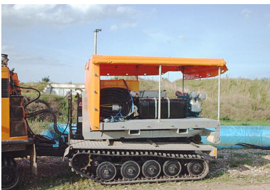
在履带式海岸防护车